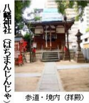
八幡神社(はちまんじんじゃ) 参道・境内(拝殿)