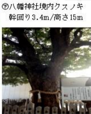
⑧八幡神社境内クスノキ 幹回り3.4m/高さ15m