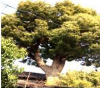
④幹回り4.4m/高さ18mのクスノキ(諸口2丁目個人邸)

保存樹とは、「緑の文化財」といわれ都市の美観維持と環境保全のために大阪府が保存を指定した樹木のことです。樹種や樹齢は問わず、幹回り1.5m以上、高さ15m以上の老樹・巨木です。また、保存樹林とは群生している枝葉の面積が500㎡以上あるものです。現在、市内で保存樹林が19カ所、保存樹が35カ所、70本が指定されており、諸口においても指定されている2本の保存樹(クスノキ)があります。